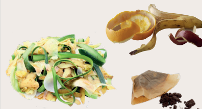
Epluchures de fruits et de légumes, pain, restes de repas, ...