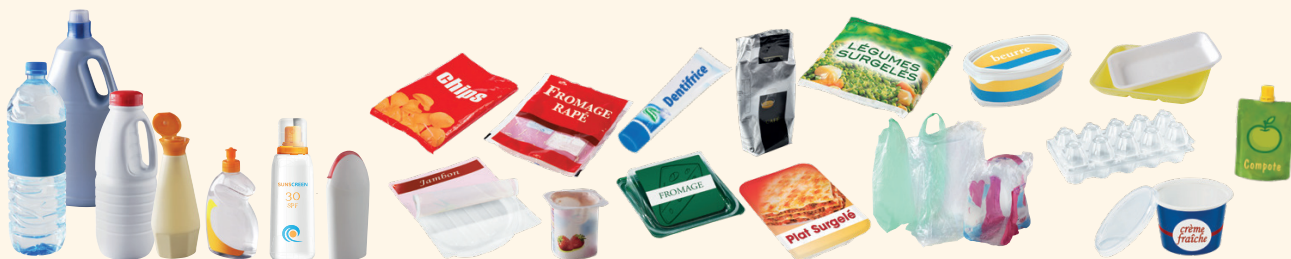
Les emballages en plastique