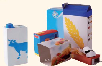
Les emballages en cartonnage

A déposer dans votre sac jaune, bac ou colonne